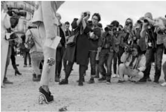
Street style photographers capturing a fashionista's outfit at Paris Fashion Week.

Anna Wintour. Annie Leibovitz. Karl Lagerfeld. These are all names you may have heard of, as they have become household figures with the iconic work they create. They have worked all their lives to come to the position of where they are today. But what if one day, a college student interested in fashion decided to start a blog, where she/he would document their everyday activities and thoughts. And what if one day they ran these iconic names out of business? Well that's exactly the case for millennials who have taken over the fashion industry with their popular blogs, which have garnered hundreds of thousands of followers.