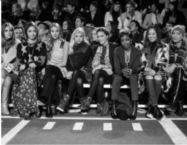
Bloggers Chiara Ferragni, Aimee Song, and Bryanboy sitting next to model Sofia Richie and DJ Harley-Viera Newton front row at NYFW at the Tommy Hilfiger show.