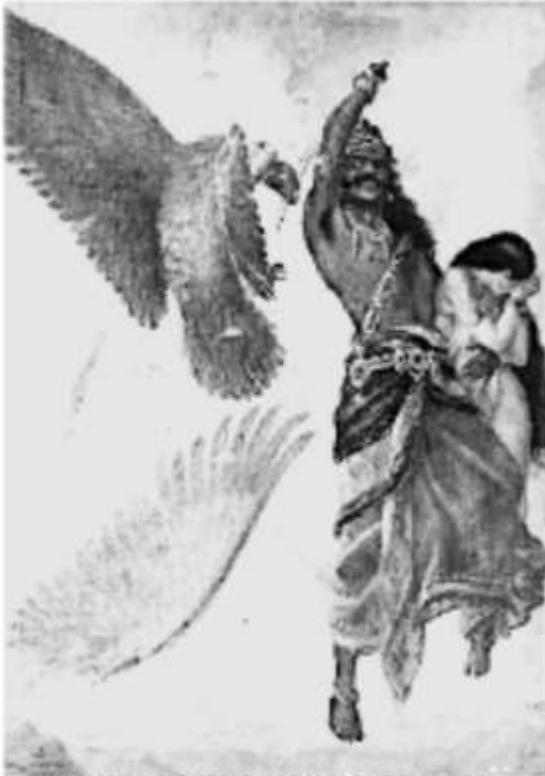
RAVANA FIGHTING JATAYU ENROUTE TO LANKA WITH ABDUCTED SITA - A PAINTING BY RAJA RAVI VARMA

Vishwakarma is credited with the design and execution of flying chariot (Puspaka Ratha) that gods use to move around. The popular Indian epic Ramayana describes